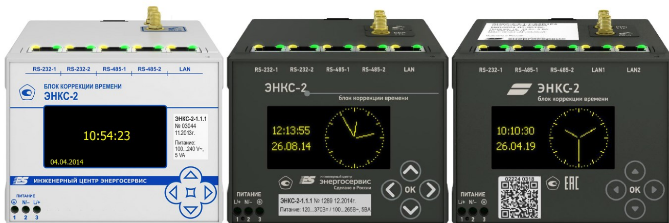
Рисунок 1 – Общий вид БКВ